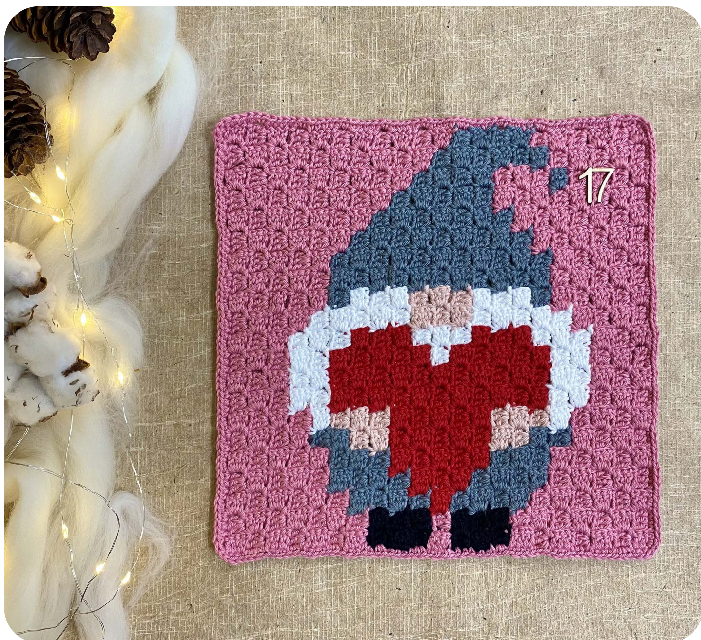
Casella 17 Gnomo