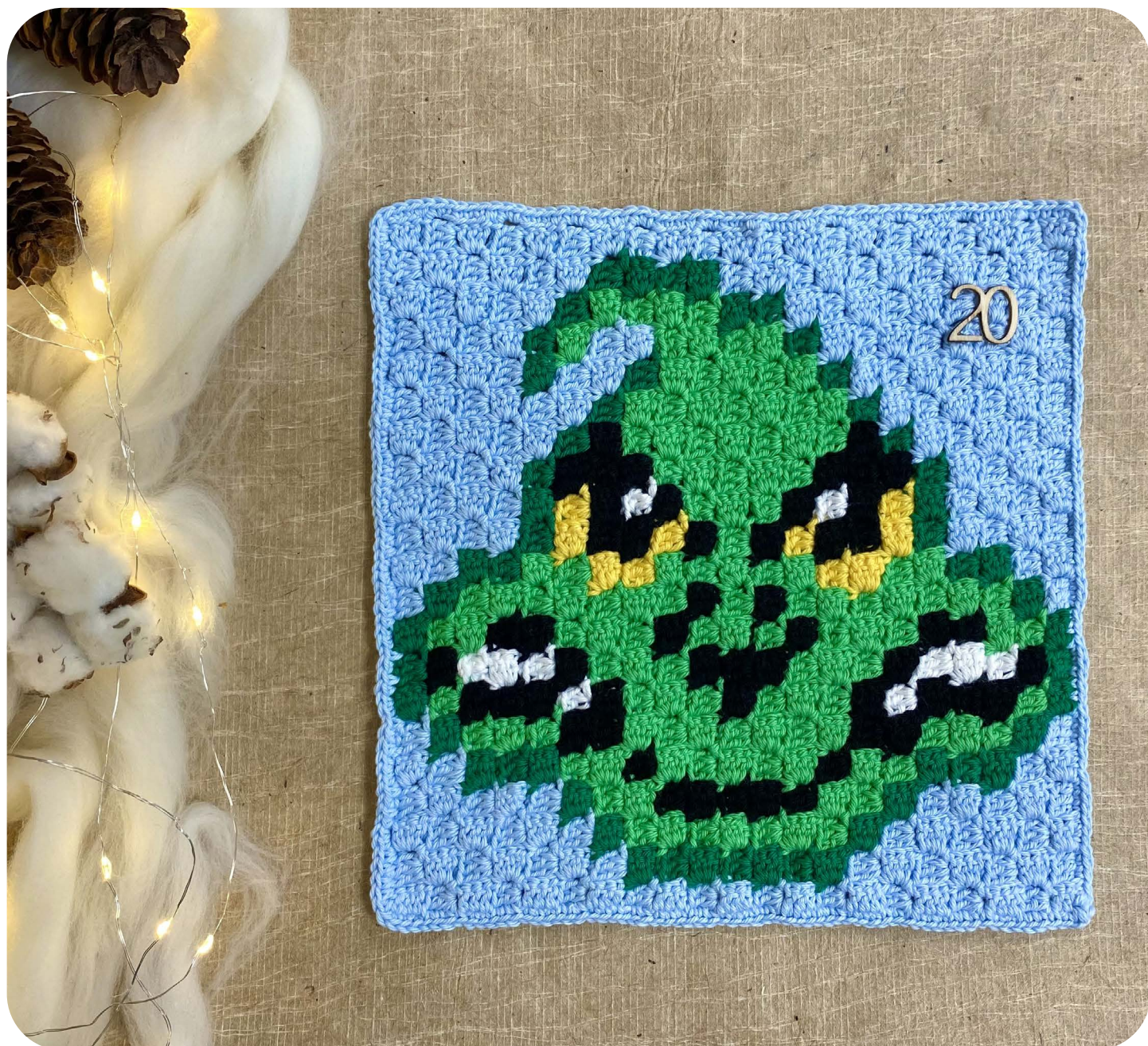
Casella 20 Grinch