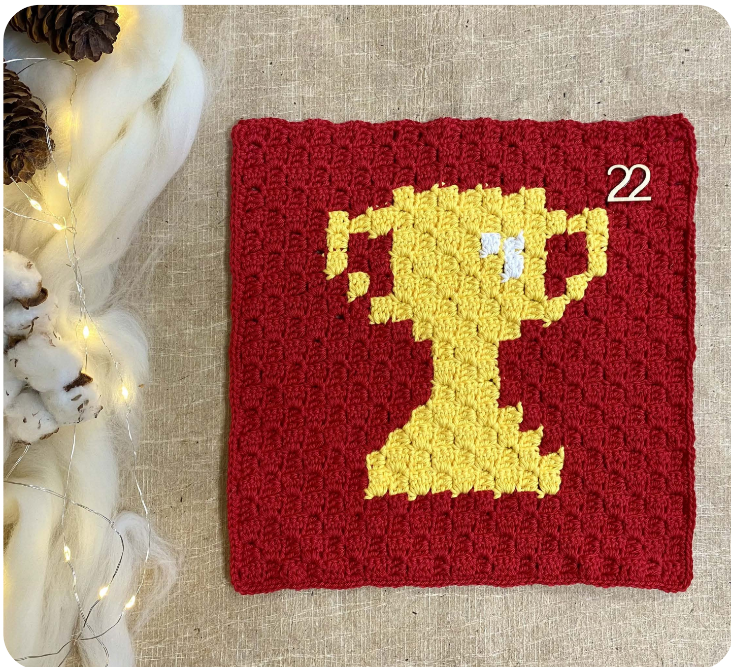
Casella 22 Coppa