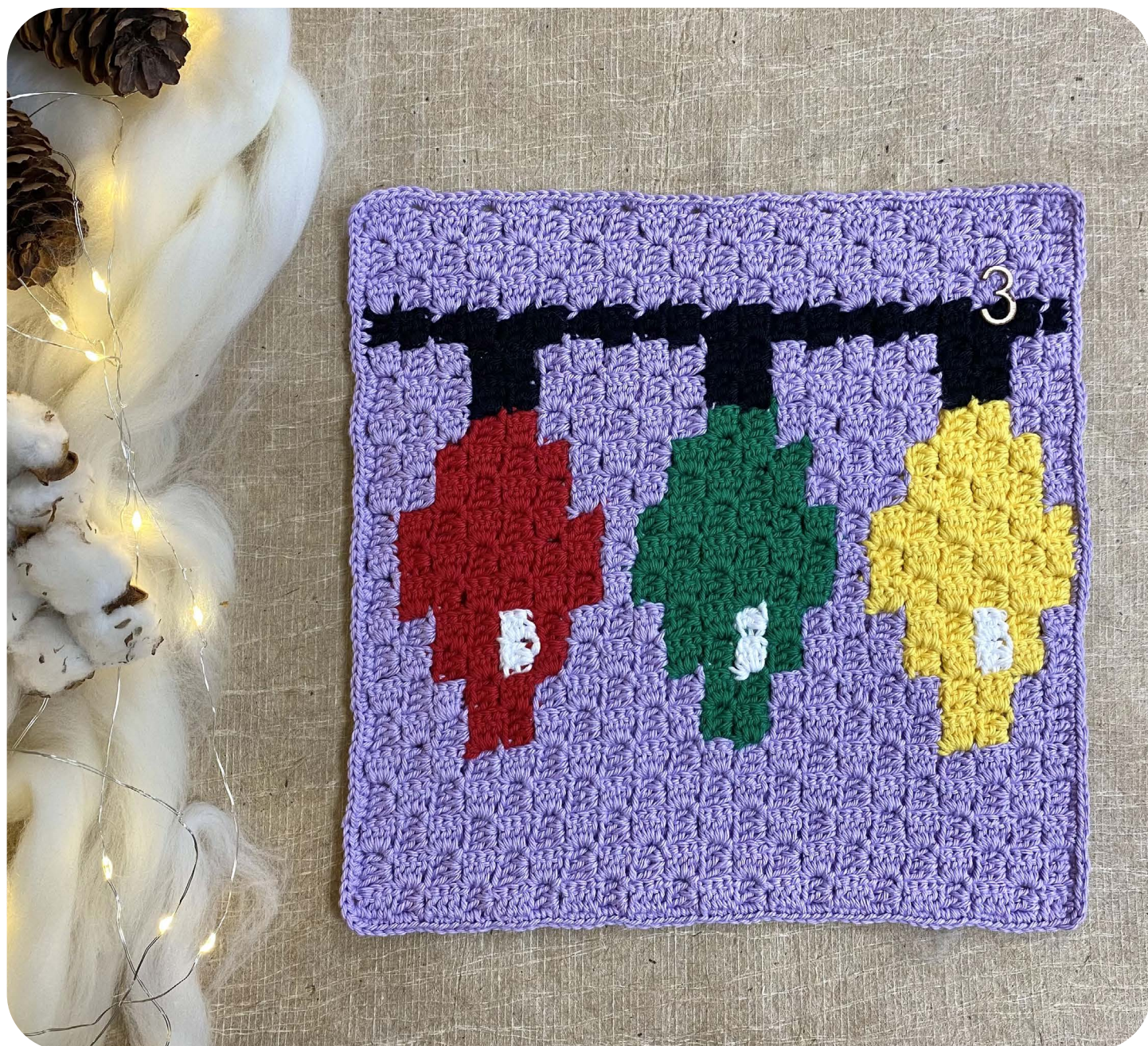
Casella 3 Luci