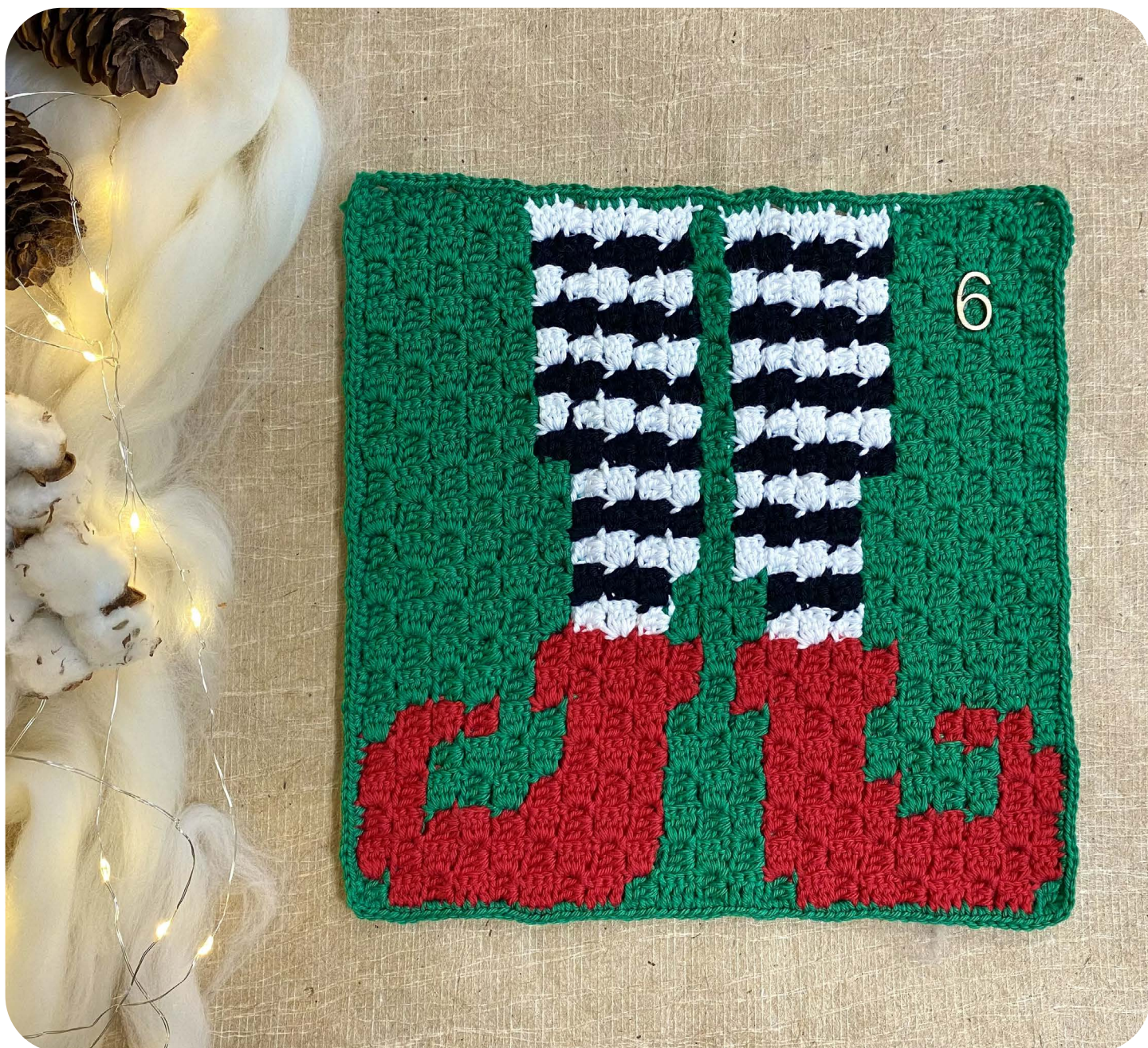
Casella 6 Elfo