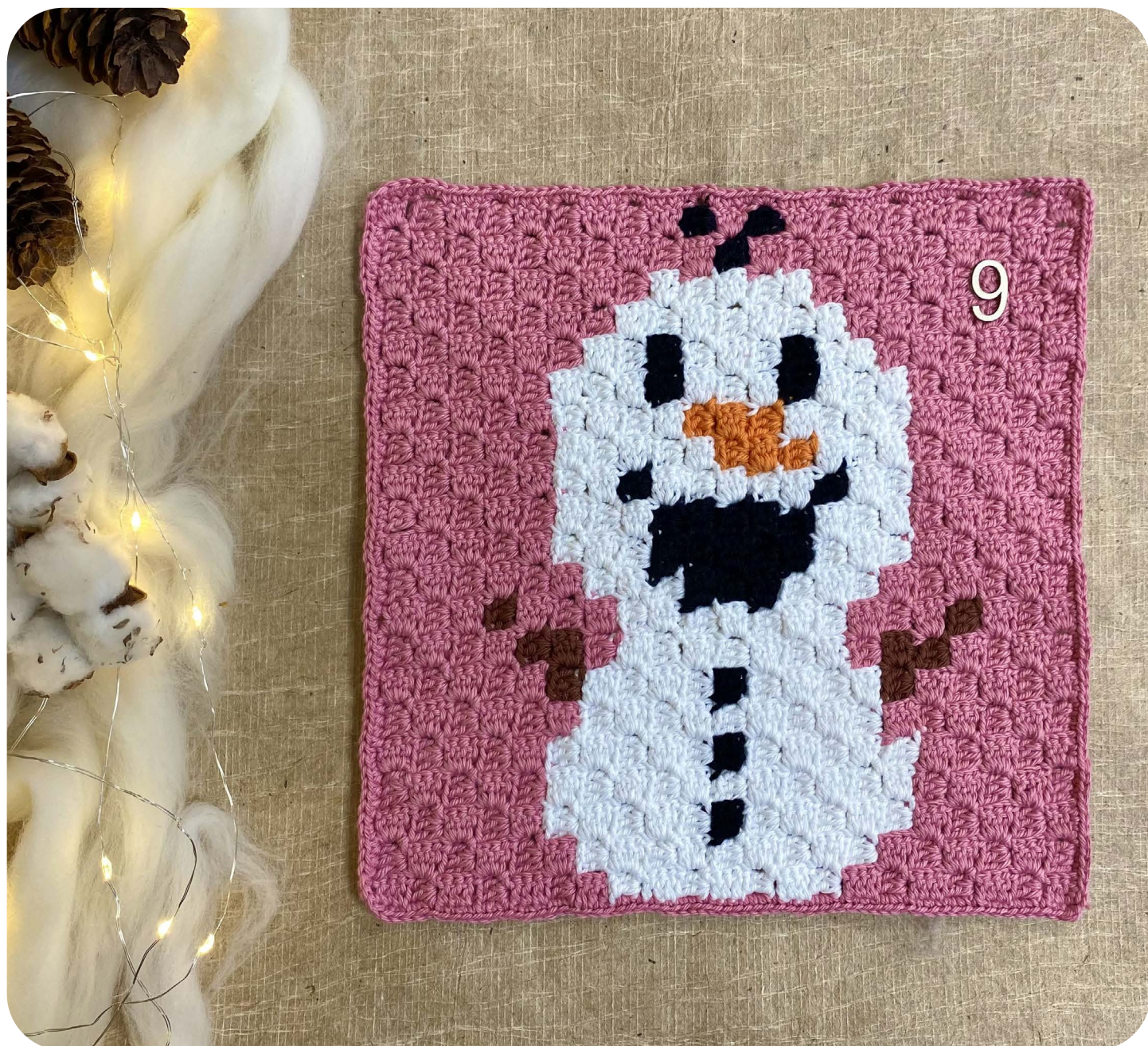
Casella 9 Pupazzo di Neve